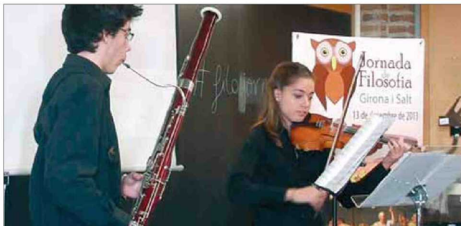
Dos joves interpretant unes peces musicals en la jornada de l'any passat ■

Aquesta serà la sisena edició de les Jornades de Filosofia de batxillerat que commemora, com cada any, el dia mundial de la filosofia decretat per la