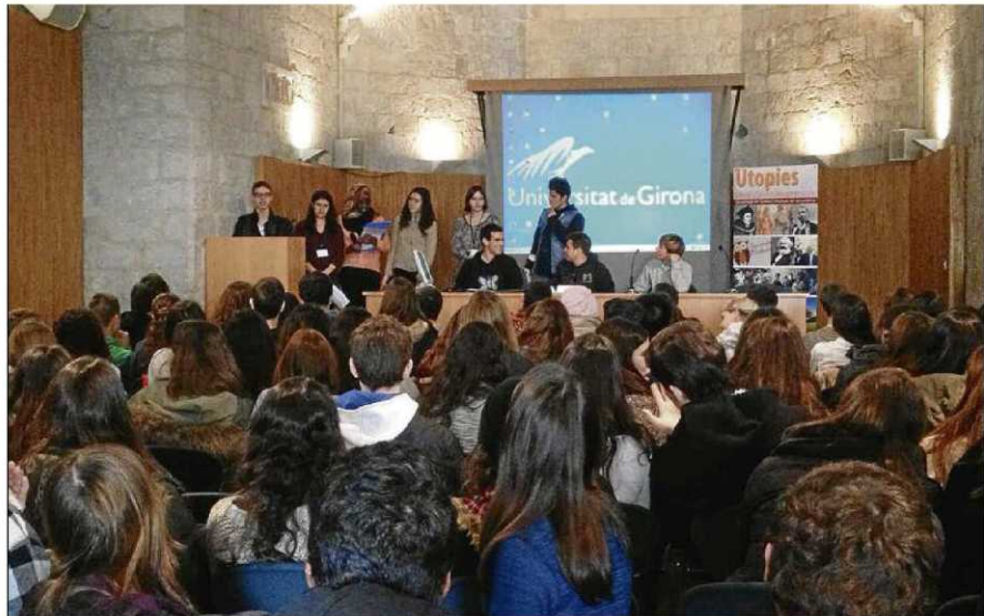
Una de les aules de la Facultat de Lletres de la UdG on divendres es va celebrar la jornada de Filosofia.

Els responsables de la jornada van recordar que les utopies polítiques constitueixen un gènere literari que es remunta a Tomàs Moro i a Plató, dos autors que l'alumnat ha de treballar en el currículum d'Història de la filosofia que cursen a segon de Batxillerat. Des del seu punt de vista, d'aquesta manera es fa evident que matèries com la filosofia poden ser de gran utilitat per a la formació dels futurs ciutadans.