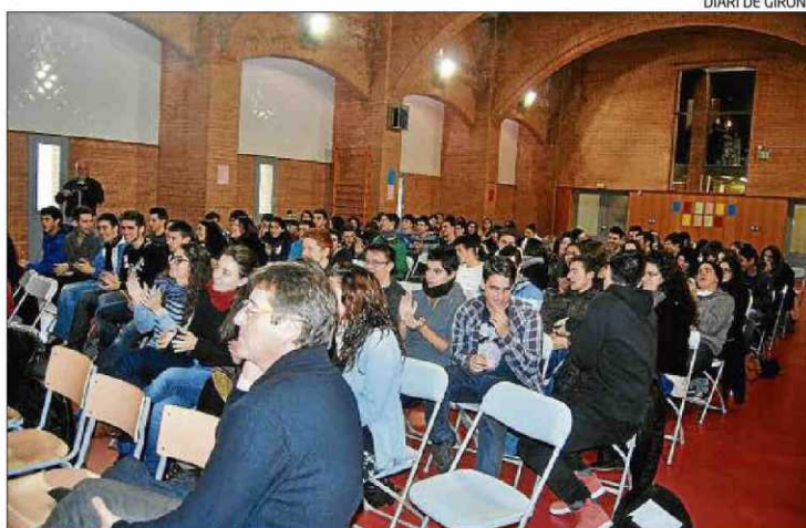
Una sessió de la quarta jornada, celebrada el 2012 a Figueres.

Aquesta experiència es va iniciar el 2009 acotada a l'Alt Empordà, però amb el temps s'ha anat ampliant a diferents centres de la demarcació i aquest any es realitzarà sota l'empara de la UdG, amb el suport de la Càtedra Ferrater Mora, a més d'alguns ajuntaments i edi-